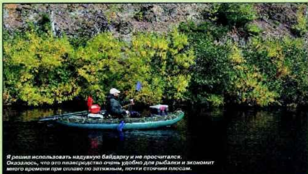
Я решил использовать надувную байдарку и не просчитался. Оказалось, что это плавание очень удобно для рыбалки и экономит много времени при сплаве по затихшим, почти стоячим плесам.

Реки северо-восточного Сахалина имеют не слишком большой уклон и прозрачную, чайного оттенка воду. Вода в них ред-