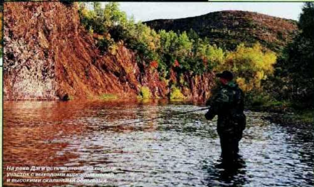
На реке Даги есть несколько хороших участков с выходящим из воды камнем и высокими скалистыми обрывами.

Пейзажи северо-востока Сахалина не столь грандиозны, как на Камчатке или в горных районах Восточной Сибири. Вал вообще протекает среди сплошной песчаной равнины; на Даги, правда, есть скальные обрывы. Кроме того, на больших